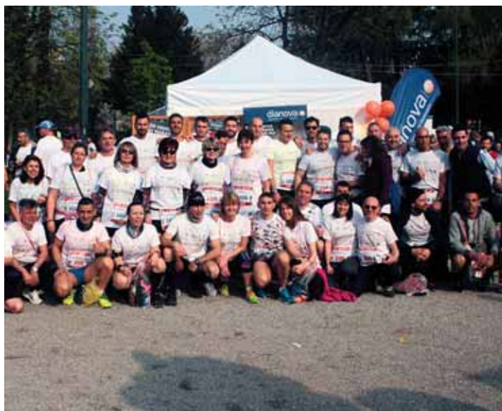
Foto di gruppo dei nostri runner prima della partenza