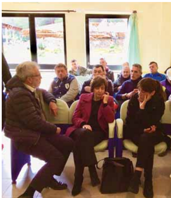
Il Dott. Mura nel corso del dibattito

A inizio marzo la Comunità di Ortacesus ha ricevuto la gradita visita del Dott. Mauro Mura, ex procuratore capo di Cagliari, nell'ambito di un incontro sul banditismo sardo previsto dal progetto di scolarizzazione. Dal 2015, infatti, in collaborazione con il Ministero della Pubblica Istruzione e con i docenti del C.P.I.A. (Centro Provinciale Istruzione Adulti) n°1 di Cagliari, è attivo nella struttura il progetto di scolarizzazione "Non è mai troppo tardi: portiamo la scuola in comunità", che ha fra i suoi principali obiettivi il raggiungimento della licenza media inferiore e il completamento del biennio di formazione secondaria di secondo grado da parte degli utenti. Durante l'incontro è stato proiettato il film "Arcipelaghi", pellicola incentrata sul processo ai danni di un ragazzo di 14 anni accusato di omicidio, che ha dato vita ad un interessante dibattito al quale hanno partecipato attivamente anche i ragazzi della Comunità. Dato il buon fine dell'incontro, il Dott. Mura si è reso disponibile per altre iniziative future. Una bella occasione di confronto e crescita per tutti gli utenti che potranno proseguire nel loro percorso terapeutico e di scolarizzazione con ancora più entusiasmo e voglia di approfondire la propria conoscenza riguardo a nuovi argomenti.