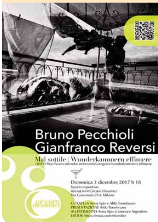
La locandina della mostra "Mal Sottile"

Lo scorso dicembre gli scatti del reportage "Another Family" sono stati oggetto della mostra fotografica "Mal Sottile", tenutasi presso lo spazio MicroLive di Milano.