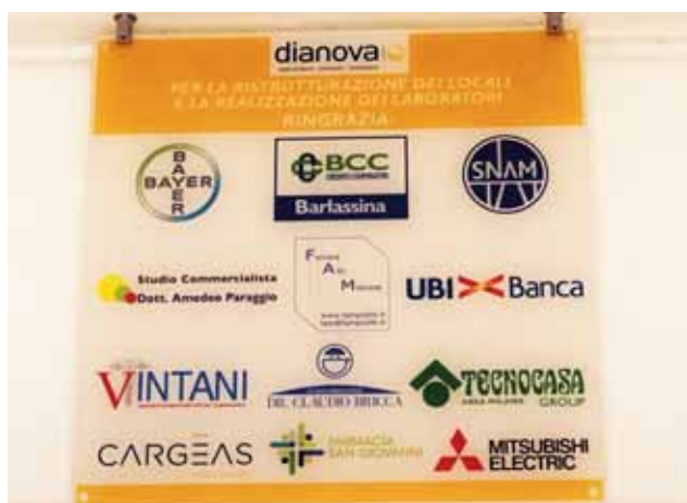
La targa apposta nei laboratori per ringraziare i nostri partner

Aiutaci ad offrire nuove opportunità ai nostri ragazzi: sostieni il progetto "E dopo di noi... Un ponte verso l'autonomia!"