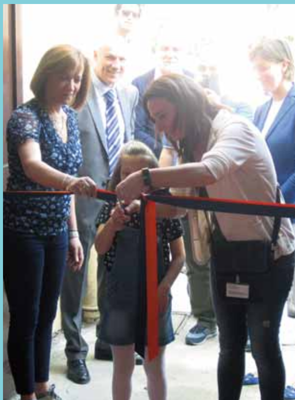
Il taglio del nastro inaugura la nuova palestra

La giornata è proseguita con la proiezione video dei momenti salienti del IX Memorial Marovelli per poi concludersi con un buffet all'aperto preparato dallo staff e dagli utenti della struttura.