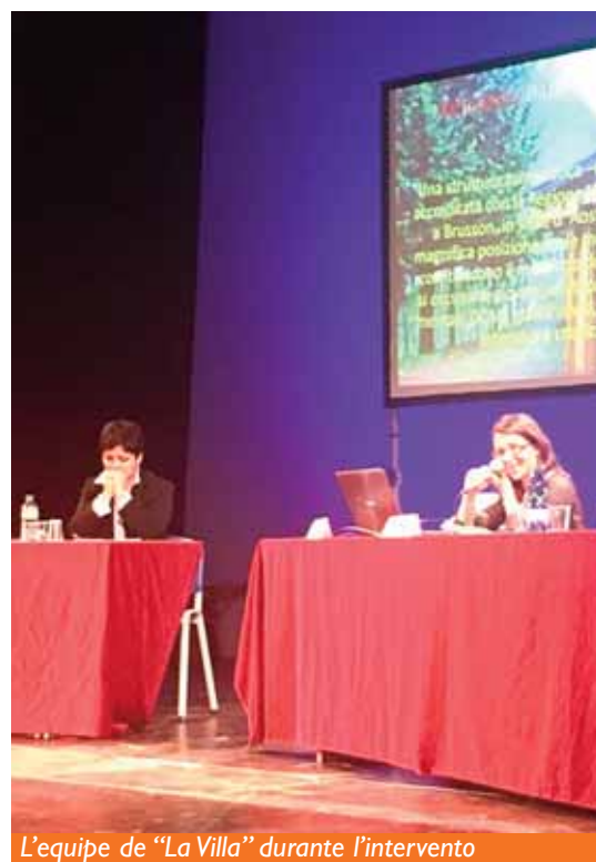
L'equipe de "La Villa" durante l'intervento

Il contributo di Dianova ha messo in luce i benefici derivanti dall'applicazione della metodologia esperienziale nel proprio contesto, una proposta educativa che favorisce l'acquisizione di competenze e abilità attraverso la sperimentazione di nuovi compiti e ruoli con l'obiettivo di portare i giovani ospiti ad indentificare ed esprimere i propri sentimenti, controllare gli impulsi e stabilire degli obiettivi. Altro concetto molto importante ad essere stato evidenziato è quello di empowerment, inteso come capacità di mettere i minori nella condizione di poter essere realmente responsabili della propria vita e del proprio progetto educativo, dunque delle proprie scelte. Una bella occasione di condivisione e confronto con altre realtà afferenti all'area minori per dare risposte sempre più adeguate nell'ambito del disagio giovanile.