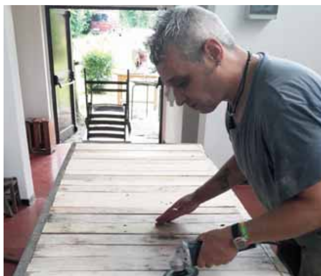
Uno degli utenti impegnati nel laboratorio di falegnameria