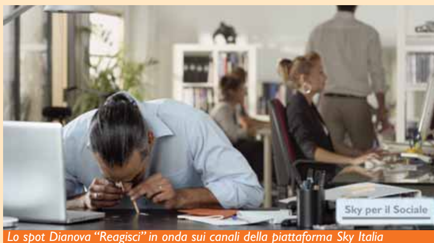
Lo spot Dianova "Reagisci" in onda sui canali della piattaforma Sky Italia

L'azione che Dianova vuole mettere in atto attraverso lo spot è quella di aiutare le persone a prendere decisioni responsabili, offrendo loro i servizi che si sviluppano all'interno delle sue Comunità o orientandole verso altre soluzioni.