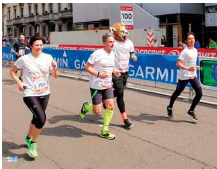
Una delle staffette sta per tagliare il traguardo

Un grazie di cuore a tutte le aziende che con i loro dipendenti hanno preso parte attivamente alla staffetta benefica e che hanno sostenuto la causa con grande entusiasmo e senza alcuna riserva: